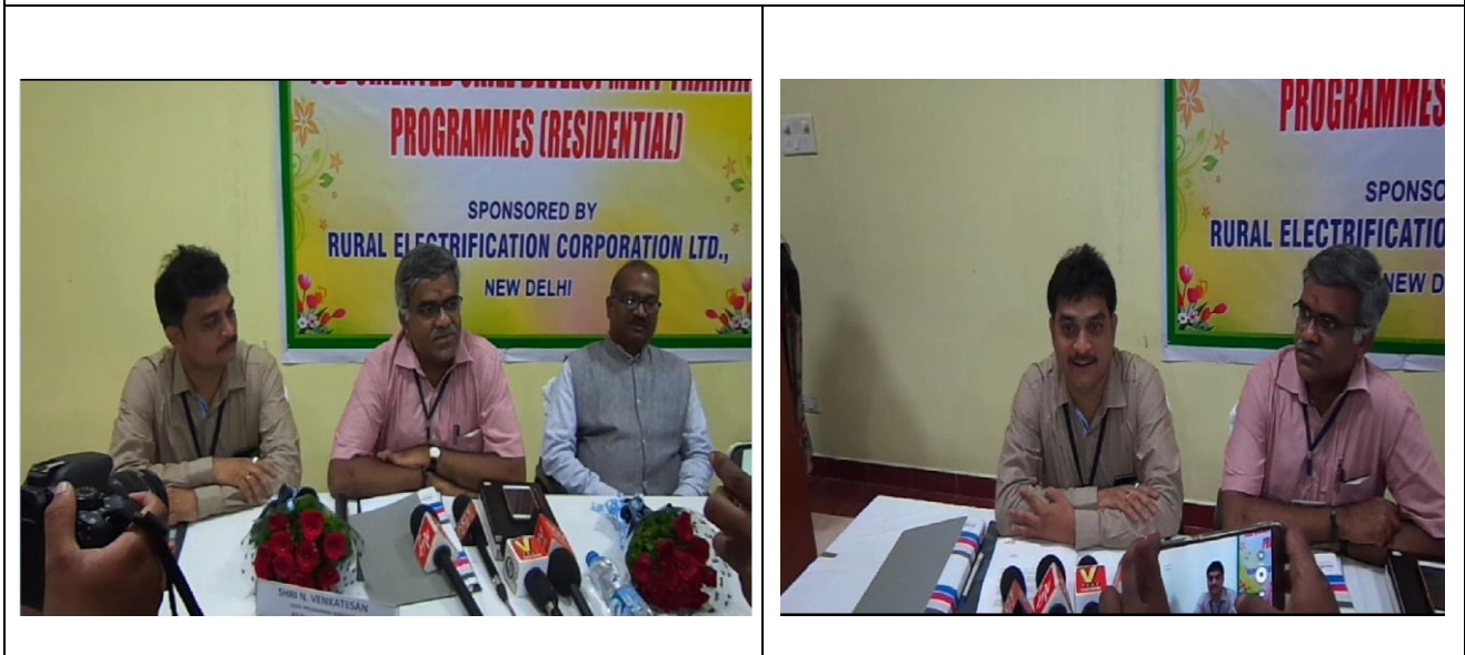
Addressing to the media